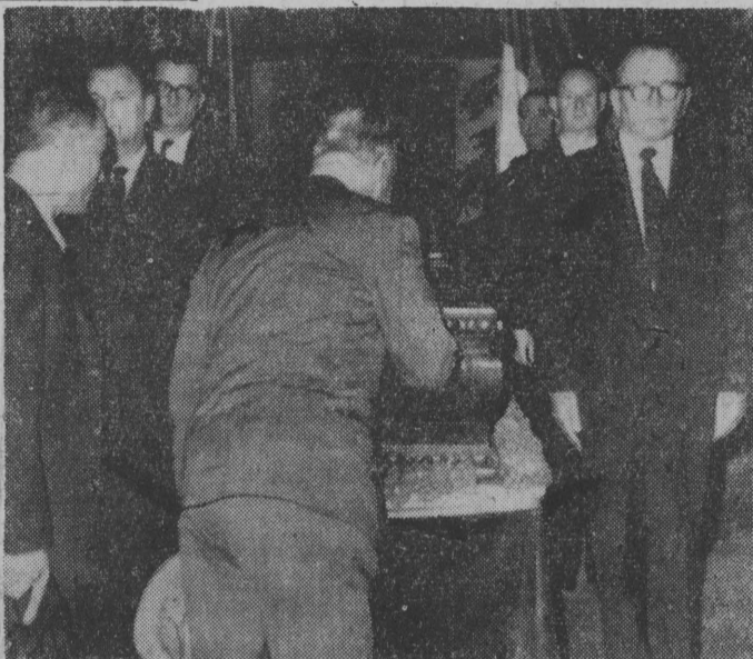
Członkowie delegacji polskiej (z przodu) i delegacji włoskiej (z tyłu) w trakcie pogrzebu w Palmiro Togliattim.

MOSKWA (PAP) — 25 bm. opuściła Moskwa, udając się do Paryża, delegacja Neo Lao Haksat, której przewodniczy książę Souphanouvong. W stolicy Francji członkowie delegacji spotkają się z przywódcami trzech ugrupowań politycznych Laosu.