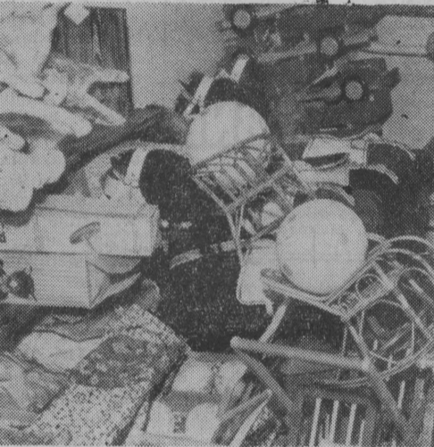
Nowe zabawki czekają na małych właścicieli.