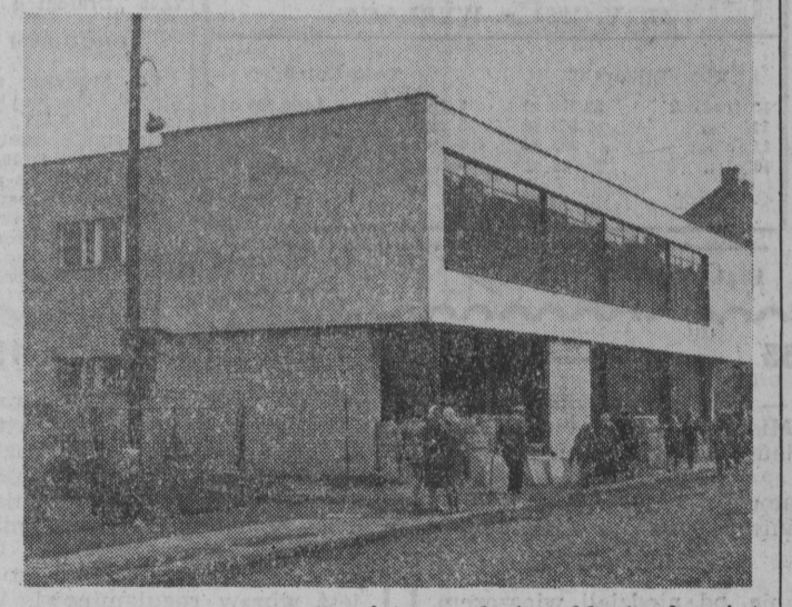
Suwalczanie z niecierpliwością oczekują oddania do użytku nowego pawilonu handlowego PSS przy ul. 22 Lipca, którego budowa znacznie przeciągnęła się. NA ZDJĘCIU: fragment budowy.

Także mieszkańcy Sokółki w pow. łapskim wpisali się na czerwonokrząską listę honorowych krwiodawców. Ostatnio krew oddawali tam na potrzeby lecznictwa nauczycieli, kolejarze, pracownicy GS i inni. (a)