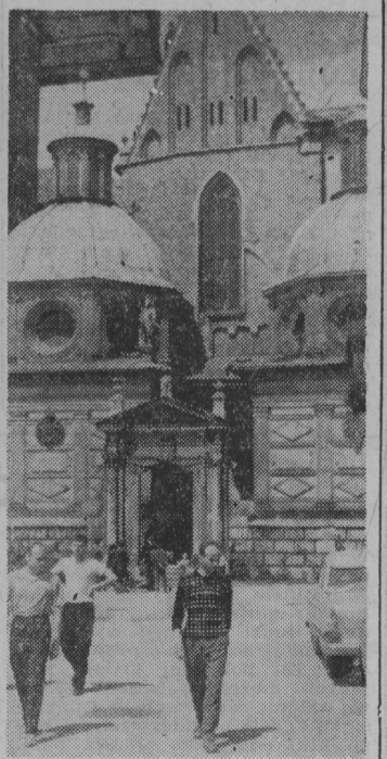
Zamek wawelski i katedra są magnesem przyciągającym turystów krajowych i zagranicznych.

BUKARESZT (PAP) — 20 bm. przybył do Rumunii z tygodniową wizytą oficjalną prezydent Jemeńskiej Republiki Arabskiej marszałek Abdullah As SALLAL.