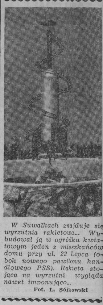
W Suwałkach znajduje się wyrzutnia raketowa... Wybudował ją w ogrodzie kwiatowym jeden z mieszkańców domu przy ul. 22 Lipca (obok nowego pawilonu handlowego PSS). Raketa stojąca na wyrzutni wygląda nawet imponująco...

Szczególnie rozżaleni byli wszyscy telewizorzy z Osowca kibicujący wyścigowi kolarskiemu, gdy w najciekawszym momencie „Szmaragd” zgasił, zamilkł i znów trzeba go było oddać do remontu. — Jak to, kolarze jada, a my ich nie widzimy! — skarżą się mieszkańcy Osowca z cichą nadzieją, że grajewski ZURiT szybko i solidnie naprawi im „pechowy” aparat, a oni zdążą jeszcze obejrzeć ostatnie etapy XVII Wyścigu Pokoju. (m)