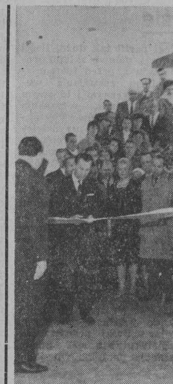
Uroczysty moment przecięcia wstęgi.

Piękną i pożyteczną akcję budowy wiejskich ośrodków zdrowia prowadzi Komitet Wojewódzki SFOS. Akcję tę rozpoczęto w roku 1960, a do 1965 roku województwo nasze będzie miało 9 wiejskich ośrodków zdrowia.