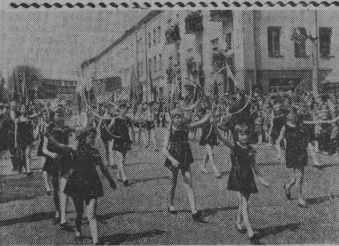
Młodość, radość, piękno — oto cechy pochodu gwiazdzistego.

Po zakończeniu części oficjalnej uczestnicy spotkania obejrzeli program ZMS-owskiego kabaretu Arka Medyka, nt. „Wizerunki”. (fw)