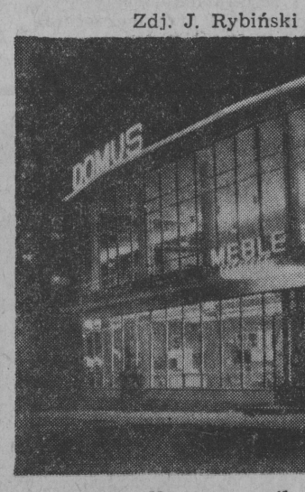
Nowy pawilon handlowy „Domus”.

Radecki, dziękując władzom miejskim za pomoc w uruchomieniu nowej placówki, a inżynierom, budowniczym i plasternikom za trud wniesiony w budowie i urządzenie białostockiego pawilonu. Goście zwrócili również mieszkanie urządzone meblami segmentowymi, które są w sprzedaży nowego pawilonu. Mieszkanie to znajduje się w bloku BSM przy ul. Mazowieckiej 37 i można je, będzie oglądać od 10 do 24 maja br. Zwiędzający będą mogli prekonać się o użyteczność mebla segmentowych, które wnetrzem mieszkalnym nadają ton nowoczesności, są wygodne i ładne.