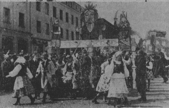
Mały teatr na ulicy. Młodzież Technikum Budowlano-Drogowego inscenizuje „Wesele” Wyspiańskiego.