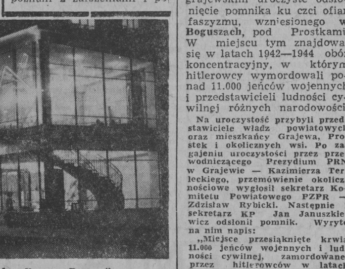
Nowy pawilon handlowy „Domus”.

PRAKTYKA w wielu powiatach wykazuje, że nie została wykończona jeszcze jedna ważna forma pracy wychowawczej — wśród kandydatów. Chodzi o aktywność i wyrazisty dających rekomendacje. Wiadomo, że są to członkowie partii o dłuższym stażu partyjnym, zapoznani z założeniami i po-