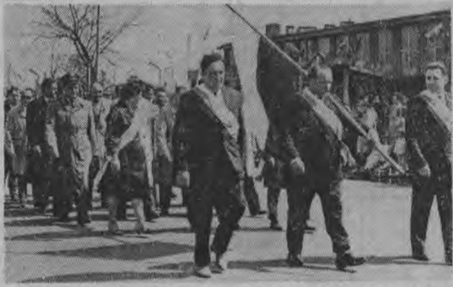
Wczoraj otrzymaliśmy fotograficzne migawki z obchodów Święta Pracy w Łapach. Na zdjęciu pierwszym: trybuna pierwszomajowa. Pośrodku orkiestra Zakładów Naprawczych Taboru Kolejowego, otwierająca pochód. U dołu fragment pochodu.