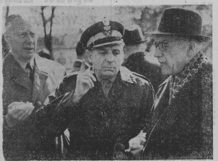
NA ZDJĘCIU: I sekretarz KC PZPR Władysław Gomułka w rozmowie z ministrem Obrony Narodowej marszałkiem Marianem Spychalskim i wicepremierem Zenonem Nowakiem na lotnisku Okęcie w Warszawie.

WARSZAWA (PAP) — W sobotę powrócił z Moskwy do Warszawy I sekretarz KC PZPR Władysław Gomułka, członek Biura Politycznego KC PZPR, prezes Rady Ministrów Józef Cyrankiewicz, członek Biura Politycznego i sekretarz KC PZPR Zenon Kłiszko, którzy do zakończenia wizyty delegacji partyjno-rządowej PRL uczestniczyli w uroczystościach 70 rocznicy urodzin N. S. Chruszczowa.