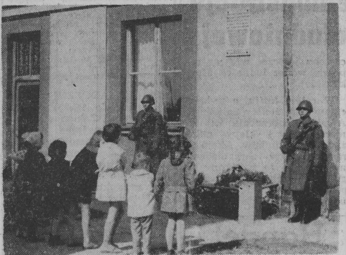
NA ZDJĘCIU: przy ul. Wesołowskiego w Białymstoku w miejscu, gdzie hitlerowscy okupanci spalili w synagodze 3 tysiące obywateli żydowskich, złożono wieniec i stanęła żołnierska warta honorowa.

rowe. Trzymali je żołnierze, harcerze, koljarze. Zapłonęły znicze. W hołdzie tym, którzy oddali życie za Polskę, za wolność i sprawiedliwość złożono wieniec i wiązanki kwiatów.