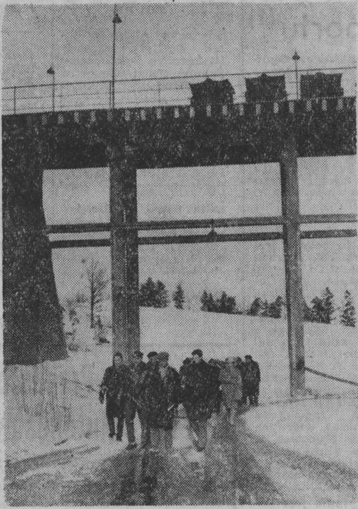
Zwiedzający wkraczają na teren cegielni.

Księgozbiór biblioteki liczy ponad 4,5 tys. tomów. Rada zakładowa przeznacza co roku 10 tys. zł na zakup nowych książek. O aktualnych nowościach wydawni-