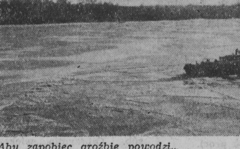
Aby zapobiec groźbie powodzi... już teraz na Wiśle w okolicach Bydgoszczy (pod Fordonem) lodołamacze kruszą pokrywe lodową.