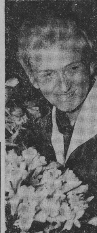
Nie zabraknie kwiatów.

We wszystkich powiatach odbywają się z okazji Międzynarodowego Dnia Kobiet akademie, wieczornice, imprezy artystyczne i spotkania ze znanymi działaczkami. Nastroj jest bardzo serdeczny. Kobiety otrzymują kwiaty, upominki, życzenia. Akademię powiatową trwać będzie trzy dni — 7, 8 i 9 bm. Natomiast role uroczystości wojewódzkiej spełni plenarne posiedzenie Zarządu Wojewódzkiego Ligi Kobiet, na którym omówiony zostanie udział kobiet w obchodach 20-lecia PRL. Posiedzenie to odbędzie się w Białymstoku, 13 marca br., w gmachu Związków Zawodowych. (K)