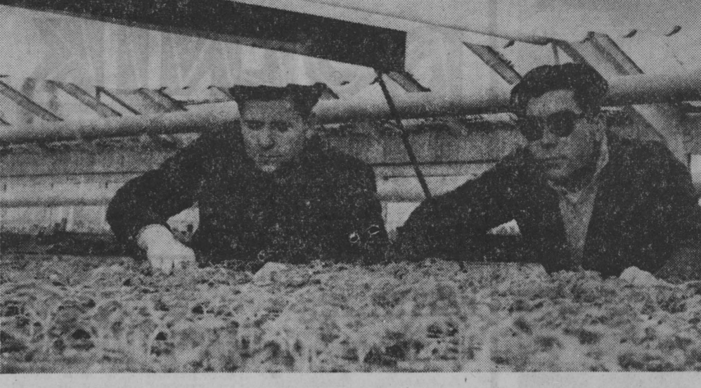
Produkcja warzyw szklarniowych w naszym województwie jest nadal niedostateczna. Sprawy tą powinni zainteresować się bardziej gospodarstwa państwowe, spółdzielcze i indywidualne.