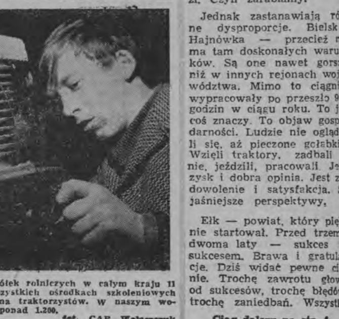
W tym kierunku trafia do kółek rolniczych w całym kraju 11 tys. ciągników. Dlatego w wszystkich ośrodkach szkoleniowych trwają zajęcia z kandydatami na traktorzystów. W naszym województwie wykwalifikowano ponad 1.200.

Straty spowodowane zachwaszczeniem zbóż ocenia się w województwie w granicach 10-15 proc. zbiorów, czyli średnio 2 t ziarna na każdym hektarze.