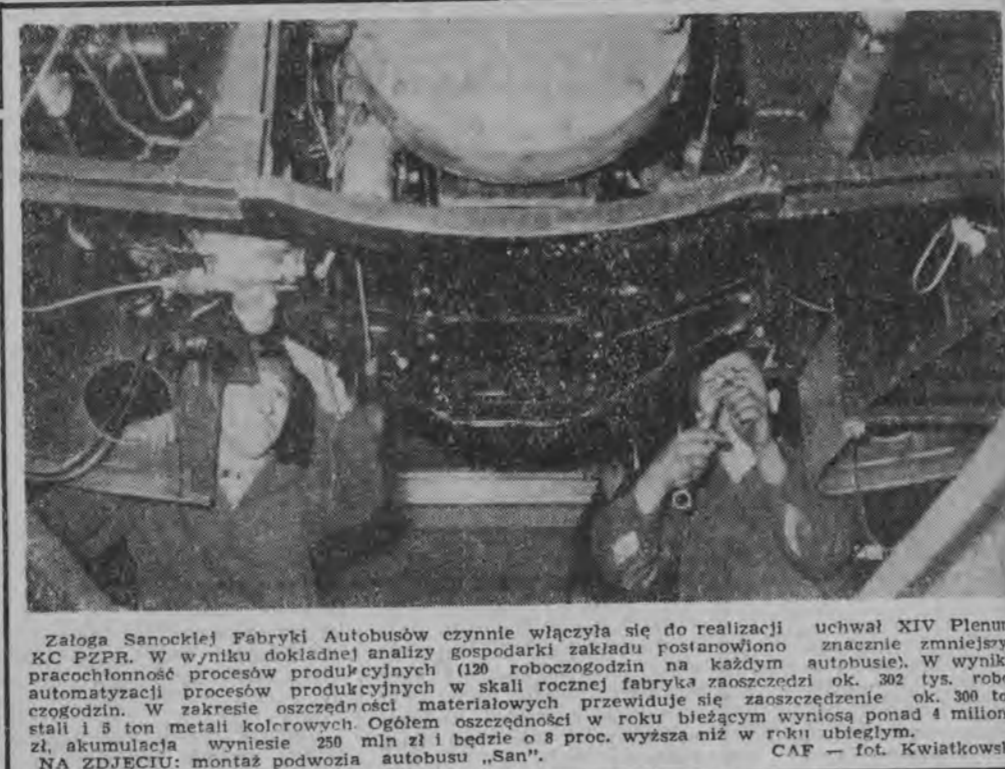
Załoga Sanociek Fabryki Autobusów czynnie włączyła się do realizacji planu...