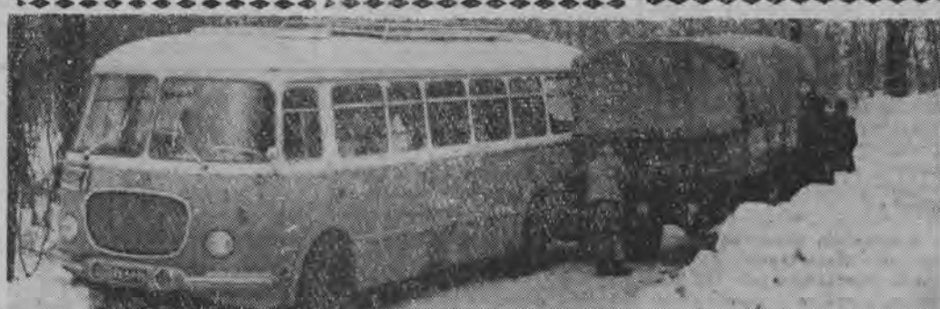
Mimo pracy pługów śnieżnych, komunikacja na drogach w województwie rzeszowskim jest nadal utrudniona. Najlepiej ilustruje te trudności nasze zdjęcie wykonane na trasie Brzozów — Rymanów. Kolizja autobusu i samochodu ciężarowego okazała się na szczęście niewielka, ale mogła być gorzej.

INDIA zaczyna protest obserwatorów ONZ w Kaszmirze w związku z zasadą zorganizowaną przez wojska pakistańskie na patrol indyjski, którego 23 członków zaginęło.