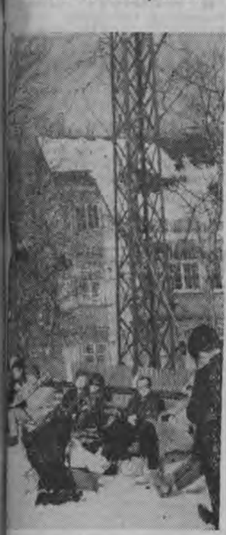
NA ZDJĘCIU: w samo południe słońce mocno przygrzewa.