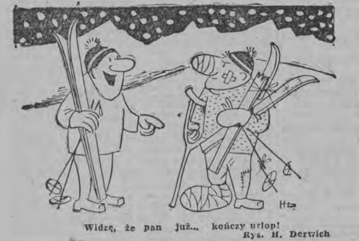
Widzę, że pan już... kończy utrop! Rys. H. Derwich