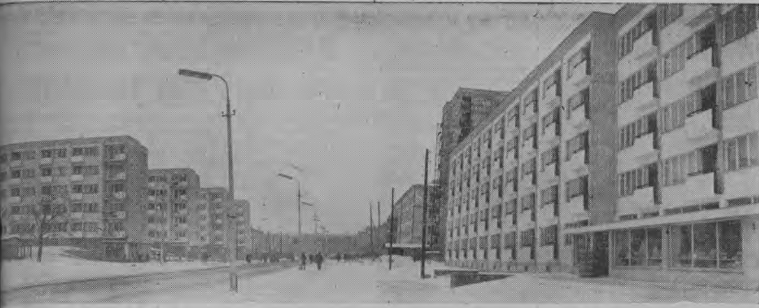
Białystok coraz piękniejszy