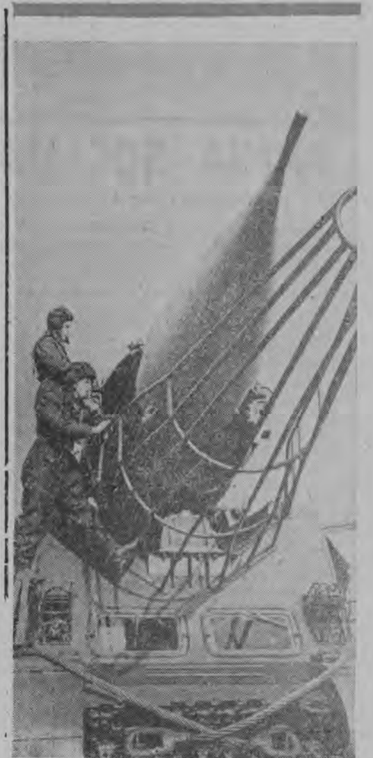
Rakietowy oddział Armii Radzieckiej podczas ćwiczeń.