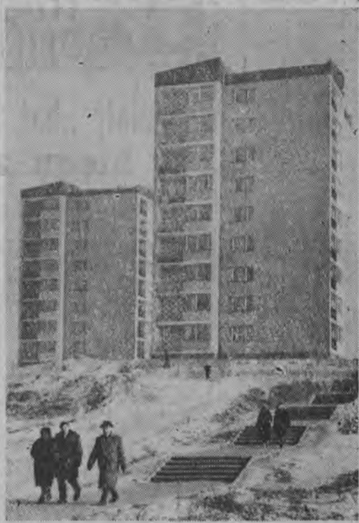
... to piękne, nowoczesne bloki mieszkalne, które wyrosły na wzgórzach nieopodal Nowej Huty.