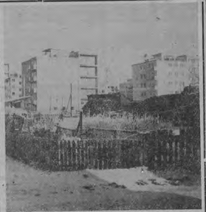
Na tle starych ruder wyrasta piękne osiedle mieszkaniowe Suwałki II. Do końca tej pięciolatki, a więc do 1965 r. powstanie w nim 19 takich bloków, jak widoczne na zdjęciu.

W programie agrominimum, który obowiązuje w naszym województwie, stawia się na czołowym miejscu zagadnienie wykorzystania wszystkich użytków rolnych. Nie może być ziem opuszczonych, zaniedbanych, czy eksploatowanych w rabunkowy sposób. Dlatego na pierwszym miejscu, w programie, pracowitości i chęciom ludzi pomocy finansowa państwa. (su)