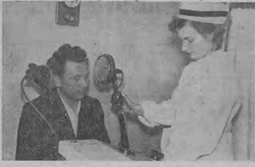
Przy Hajnowskich Zakładach Przemysłu Drzewnego istnieje dobrze wyposażone ambulatorium zakładowe i gabinet denty- styczny. Z placówek tych korzystają często pracownicy zakładów.