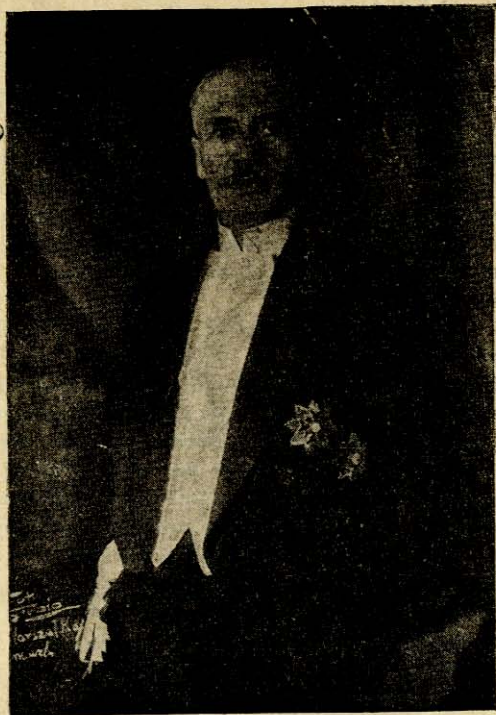
Prezydent Rzeczypospolitej Prof. Ignacy Mościcki Protector Z. H. P. i Złotu