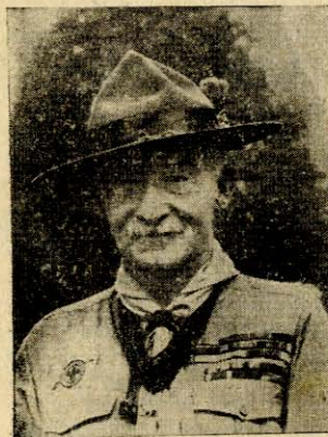
Gen. Robert Baden - Powell of Gillwel—twórca Skautingu i Naczelny Skaut Świata