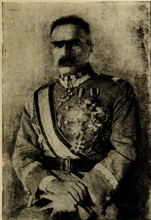
Marszałek Józef Piłsudski Patron Z. H. P.