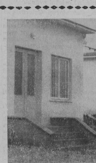
Dom Kultury w Jacznie, w pow. dąbrowskim.