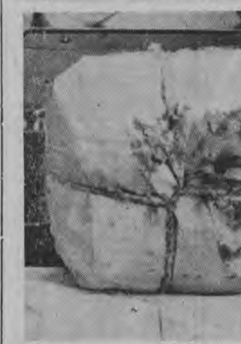
Paczka musi być dobrze zapakowana, bo inaczej nie dojdzie w całości.

na pocztach. Ludzie wysyłają swym bliskim i znajomym paczki, listy, życzenia. W każdym urzędzie pocztowym jest wzmocniony ruch. Ale wszystkie przesyłki trafiają potem do urzędu dworcowego — stąd dopiero wędrują w świat. Poczta dworcowa ma więc jeszcze więcej pracy niż inne placówki łączności.