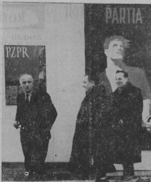
W Muzeum Ruchu Rewolucyjnego w Białymstoku czynna jest wystawa polskiego plakatu politycznego. Zawiera ona ok. 60 plakatów, stanowiących przegląd wydarzeń od 1944 r., od pierwszych chwil po wyzwoleniu, aż po czasy najnowsze.

Ponadto zarządy powiatowe ZMW organizować będą zimowiska i szkolenie aktywów we własnym zakresie. (g)