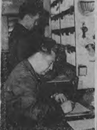
Pracownicy ambulansu pocztowego segregują korespondencje.

W DOMU Kultury na Nowym Mieście czynna jest wystawa fotografiki opolskiej. Wystawę oglądać można w godz. 14—21 do 6 stycznia 1964 r. (a)