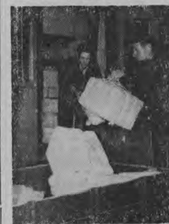
Paczki ładowane są do pociągów odchodzących we wszystkie strony Polski.

S ZUKAŁAM w biurze naczelnika Urzędu Pocztowego nr 2 LEONA PROKOPOWICZA. Odpowiedziano mi od wczoraj bez przerwy jest na dworcu, tyle jest roboty z paczkami, że i on musi pomagać. Okres przedświąteczny to czas największej pracy