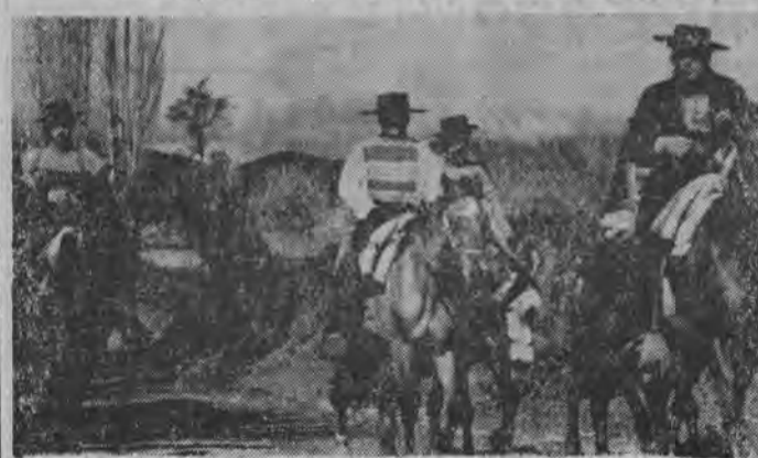
Chilijscy kowboje „Huasos” w strojach regionalnych.