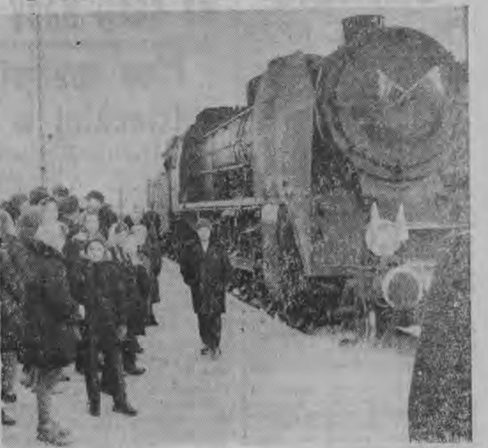
W niedzielę, 15 bm., przekazana została do użytku nowozbudowana linia kolejowa Sokółka - Kamienna Nowa. Skróci ona o 112 km przejazd z Warszawy do Augustowa. Na zamieszczonym zdjęciu widzimy właśnie mieszkańcy Sokółki, którzy serdecznie witają pierwszy, nadzwyczajny pociąg. Fotoreportaż z niedzielnych uroczystości zamieszczamy na stronie 3-ciej.