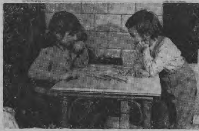
wycieczki, wyświetlane są filmy.

W czasie białych wakacji przewiduje się też choinkę noworoczną, kulig, bal kostiumowy, choinkę dla ptaków, konkurs na rzeźbę ze śniegu. Poza tym codzienne zajęcia świetlicowe, filmy, wycieczki. (a)