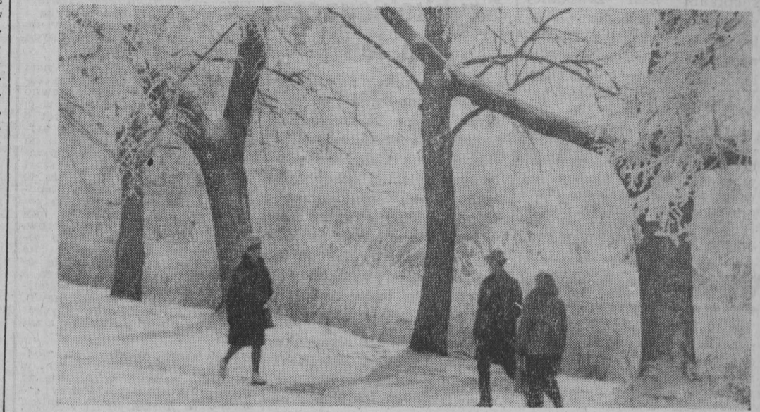
ZIMA W PARKU

Jak z tego wynika palacz nie zdał egzaminu z obsługi kotłowni c. o. (tal)