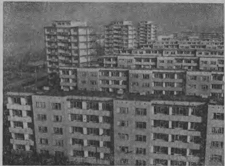
Tak wyglądają nowe osiedle mieszkaniowe przy ul. Grabiszyńskiej we Wrocławiu.