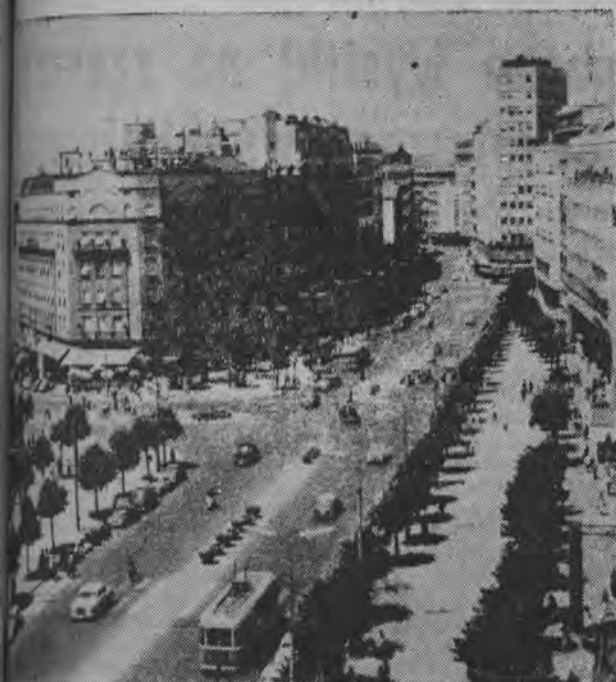
Ruchliwy plac „Terazije” w Belgradzie.