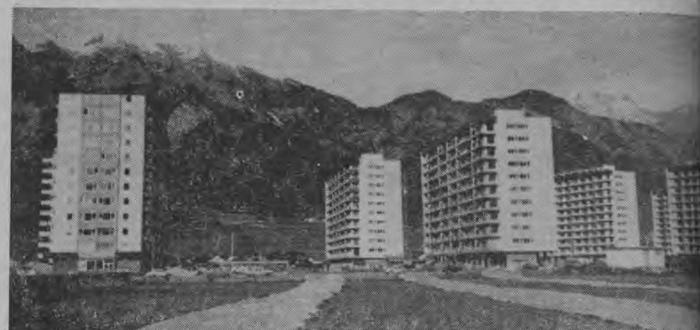
W tych wieżowcach, stanowiących wioskę olimpijską, zamieszkażą uczestnicy zbliżających się zimowych Igrzysk Olimpijskich w Innsbrucku.