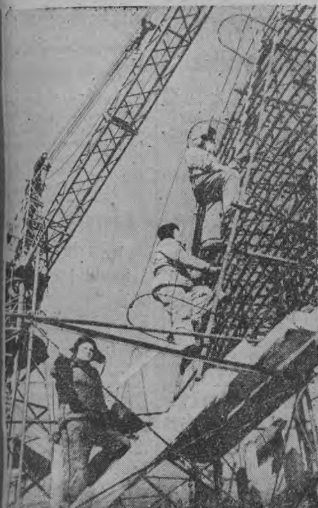
Pokłon Rewolucji Październikowej

MOSKWA (PAP) — Komentując możliwość wystrzelenia sputnika „Polet-1” kandydat nauk technicznych J. Pasyn pisze na łamach „Komsomolskiej Prawdy”, że nie jest wykluczone, iż w niedalekiej przyszłości wyrzuci się w przestrzeń pozaziemską kilka statków kosmicznych jednocześnie. Ich zadaniem będzie spotkanie się w wyznaczonym miejscu przestrzeni. Program kosmicznego rendez-vous przewidywałby przepompowywanie paliwa z jednego statku do drugiego, wymianę informacji i być może nawet dokonanie napraw w warunkach kosmicznych.