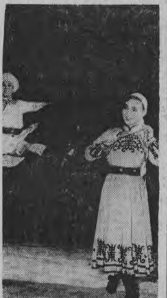
sali zrywają się długo nie milknące oklaski. Taniec pawia to jeden z punktów programu występu Centralnego Zespołu Pieśni i Tańca

NA SCENIE wspaniałe, rozpostarte ogony pawia. Naśladują go chińskie tancerki przy pomocy barwnych spódnic. Na