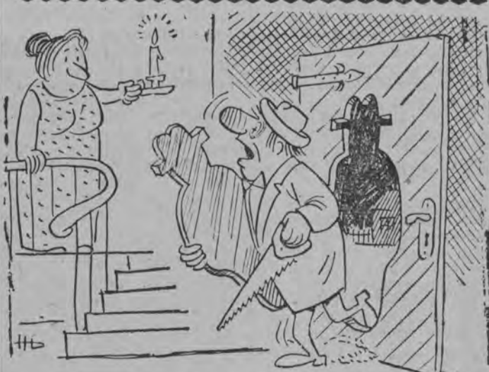
- A co miałem robić, sko o zapomniałem klucza od bramy!?

W dwóch miejscowościach powiatu - w Piekutach i Kostrach Podsekowskich, buduje się remizy strażackie. Roboty budowlane będą zakończone do końca br. (g)