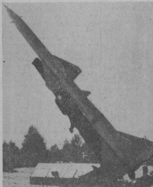
Broń raketowa Wojska Polskiego.

D LA ZILUSTROWANIA tych faktów można podać, iż np. nowoczesny samolot odrzutowy posiada 100.000 — 150.000 części, a nowoczesna stacja radiolokacyjna wstępnego poszukiwania naprowadzenia — ponad 6 tys. podzespołów elektronicznych, około 500 lamp elektronowych oraz kilkadziesiąt silników elektronicznych. Opracowanie np. projektu współczesnego samolotu myśliwskiego wymaga 20 razy