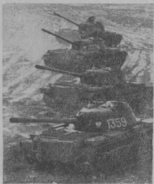
Czołgi na ćwiczeniach (rok 1962).