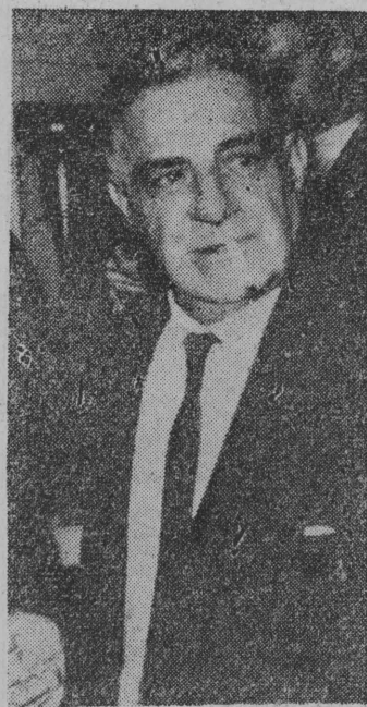
NA ZDJĘCIU: Joseph Valachi w otoczeniu funkcjonariuszy ochrony federalnej w gmachu, w którym urzęduje komisja senatorów w Waszyngtonie.

NOWY Jork (PAP) — „Jeśli sytuacja, która doprowadziła do zamachu bombowego i śmierci 4 dziewczynki nie ulegnie zmianie, będziemy urządzali demonstracje w całym mieście”. — oświadczył w poniedziałek na wiecu w Birmingham przywódca murzyński Martin Luther King. Demonstracje te „będą potężniejsze niż kiedykolwiek”.