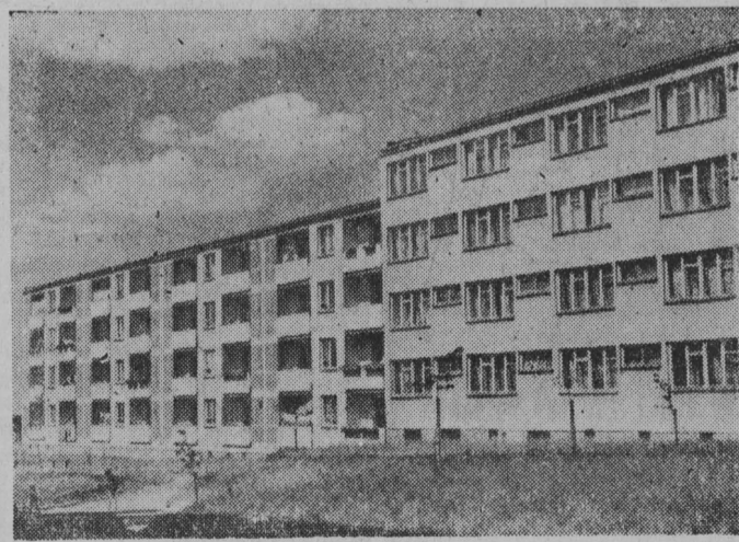
Fragment osiedla mieszkaniowego Radomskiej Spółdzielni Mieszkaniowej przy ulicy Zwirki i Wigury.