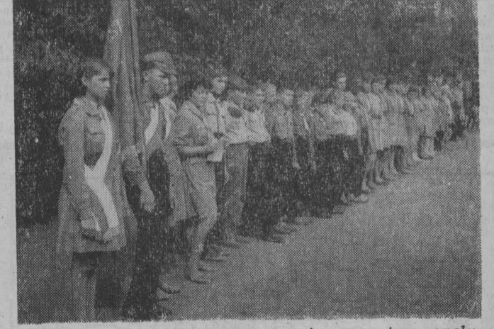
Uczestnicy lata nieobozowego w czasie uroczystego apelu.

W czasie drugiego dnia zlotu odbyły się także zawody sportowe, a ponadto kolarski tor przeszkód. Zwycięzcy otrzymali dyplomy i nagrody. (a)