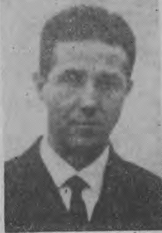
Ahmed Ben Bella.

ALGIER (PAP) — Dotychczasowy premier Ahmed Ben Bella wybrany został w niedzielny referendum pierwszym prezydentem niepodległej Algierii. Rzecznik FLN stwierdził, że według prowizorycznych obliczeń 99,82 proc. osób, które wzięły udział w wyborach, oddało swe głosy na Ben Bella. Spośród 5.318.653 uprawnionych do głosowania zjawilo się w lokalach wyborczych i głosowało 87,80 proc.