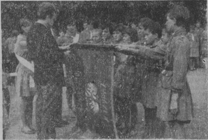
Uroczyste przyrzeczenie harcerskie.