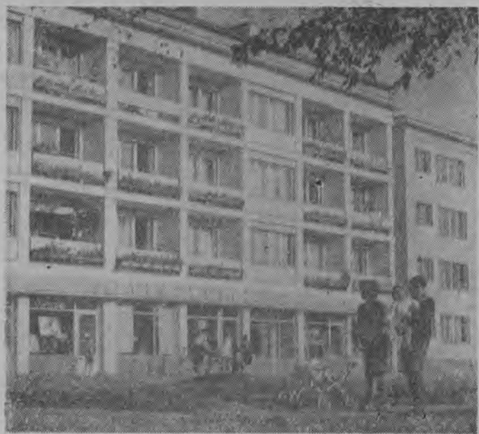
Fragment osiedla Skrzywana w Łodzi. 10 pięknych bloków zamieszkują pracownicy energetyki.