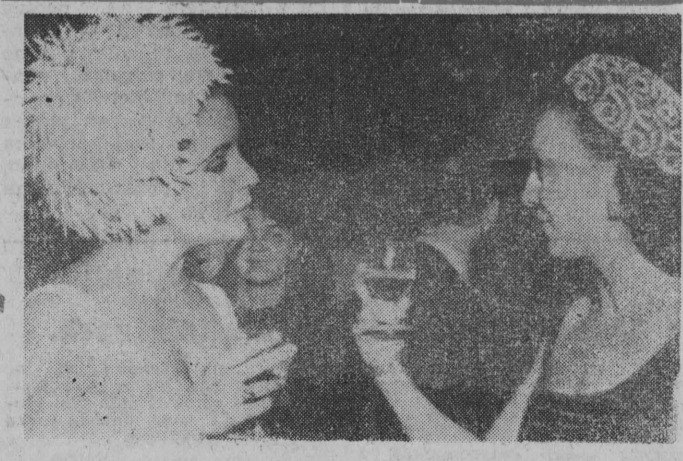
Członkowie przebywającego obecnie na występach w Londynie baletu moskiewskiego Teatru Wielkiego przybyli na pokaz głosem filmu „Kleopatra” jako goście Elisabeth Taylor — odtwórczyni roli tytułowej. NA ZDJĘCIU: wspólny toast wznoszą Liz Taylor i prima-balerina Raisa Struczkowa.

I tak, w Białostockim Przedsiębiorstwie Budowlanym, w toku dotychczasowej kontroli, stwierdzono poważne rozluźnienie dyscypliny i organizacji pracy. W Wytwórni Wyrobów Precyzyjnych w Czarnej Białostockiej okazało się, że po wyeliminowaniu niedociągnięć można będzie przystąpić o parę miesięcy wcześniej aniżeli planowano, do produkcji lodówek. We Wschodnich Zakładach Przemysłu Wełnianego ciąg dalszy na str. 2