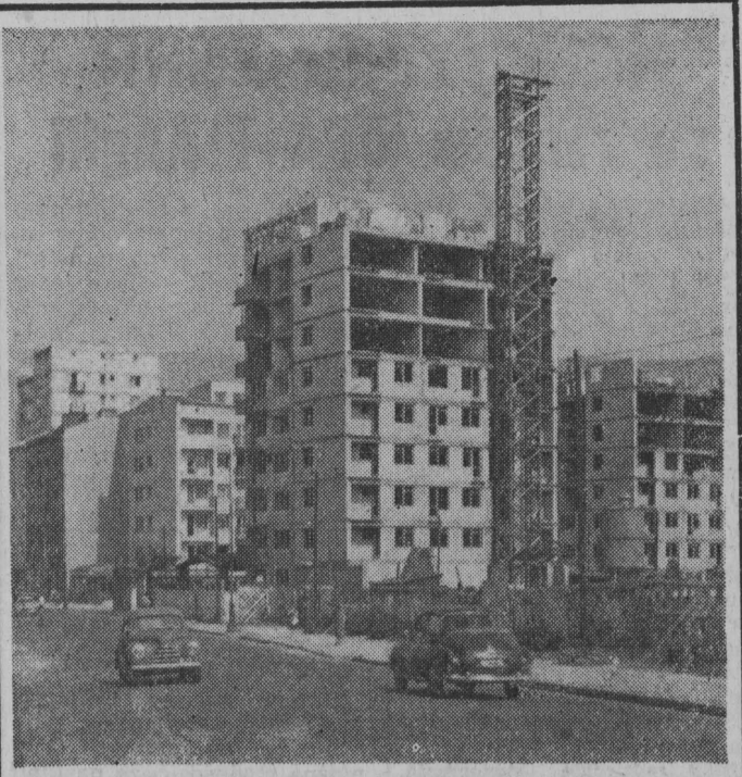
Coraz więcej domów mieszkalnych buduje się na Powiślu w Warszawie. W chwili obecnej wznoszone są domy w rejonie ulic Tamki, Solca i Radnej. NA ZDJĘCIU: budowa domów na Tamce nie opodal Solca.

ALGIER (PAP) — „Wydarzenia w Afryce rozwijają się bardzo szybko. Aby wydarzenia te przebiegały bez przeszkód, trzeba naszym zdaniem, zneutralizować wszystkie plany imperialistów, kolonizatorów i neokolonizatorów” — oświadczył premier Algierii Ben Bella w wywiadzie udzielonym przedstawicielowi agencji Prensa Latina.