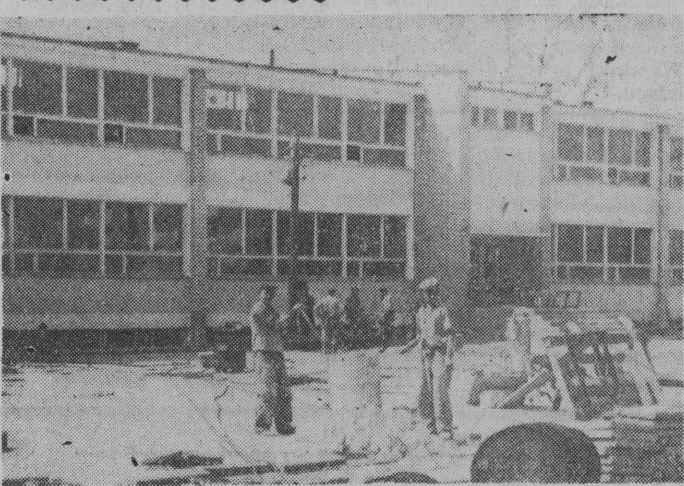
Praca na dziedzińcu szkolnym.

Powrót uczestników obozu wychowawczego, którzy przebywali w sierpniu nad jeziorem Sajno, nastąpi w piątek, 23 bm. Powitanie przybywających przez rodziców nastąpi o godz. 17 w alei przed teatrem. (h)