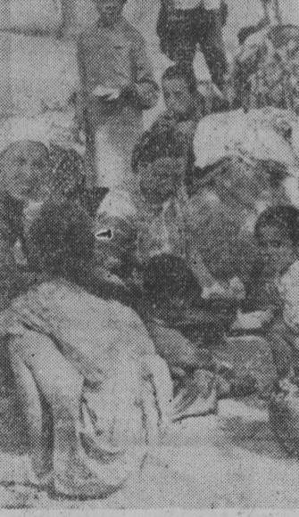
Bezdomni jedzą śniadanie na chodniku ulicznym.

Stacje sejsmograficzne notują (Ciąg dalszy na str. 2)