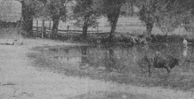
Nasze żniwniczki odczuwają dotkliwie upał. W skomurny dzień do brzo zrobił kilkanaście litrów wody, no i mała kapiel.

W dniu dzisiejszym odbył się mecz w grach polowych. Pierwszą wielką niespodzianką było zwycięstwo młodzieży z zespołu „Młodzi” z Zawiszy. W meczu tym zwyciężył zespół Zawiszy 2:1.