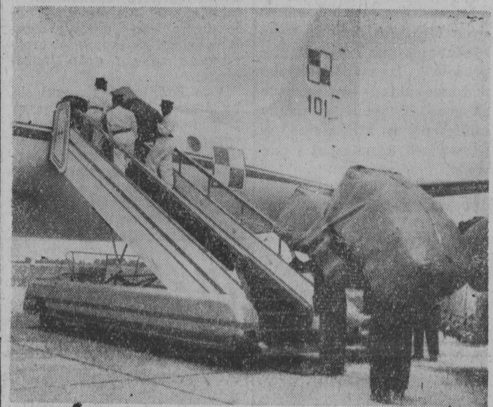
Ministerstwo Zdrowia i Opieki Społecznej wysłało w dniu 29. VII. 1963 r. kolejny transport środków krwiozastępczych, plazmy ludzkiej i opatrunków. Specyfiki przesyłane są specjalnym samolotem wojskowym.

WASZYNGTON (PAP) — Ze względów oszczędnościowych Stany Zjednoczone postanowiły zamknąć z dniem 1 września 13 konsulatów amerykańskich, m. in. w Wenecji, Haifie, Bazylei, Hawrze, Manchesterze i Salzburgu.