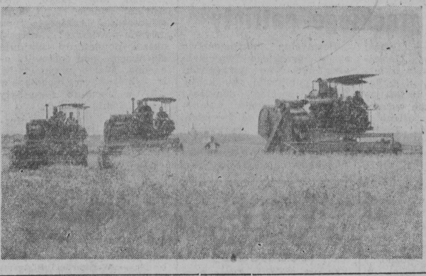
Kombinat PGR Gniechowice (woj. wrocławskie) rozpoczął już zbiór jęczmienia ozimego. NA ZDJĘCIU: koszenie jęczmienia przy pomocy kombajnow.

Ibn Saud stanowi dla Austrii prawdziwą „złota żyłę”, bo jak obliczono jego wdatki w Wiedniu, wynoszą średnio, nie licząc podarków i innych podobnych zakupów, 10 milionów sztylingów miesięcznie (400.000 dolarów).