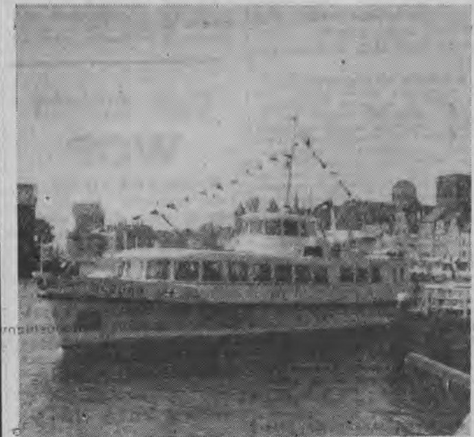
Gdańska Słocznia Rzeczna przekazała Żegludze Gdańskiej statek pasażerski „Aldona”. Jednostka ta ma 250 miejsc pasażerskich i kursować będzie po Zatoce Gdańskiej i Zalewie Wiśląnym.