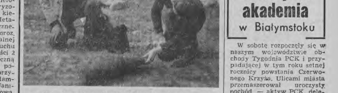
Tak nie wolno... Nawet dotknięcie niewypału grozi może natychmiastową eksplozją.