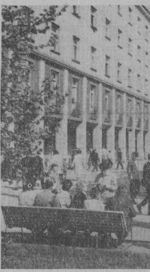
Gdańsk. Grunwaldzka Dzielnica Mieszkańcowa w Gdańsku-Wrzeszczu.

Wśród wielu problemów, które przez 8 dni będą przedmiotem obrad, na czoło wysuwa się zagadnienie specjalizacji w produkcji kwalifikowanych nasion