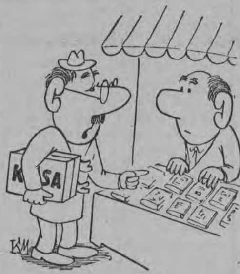
— Masz pan może kodeks karny?