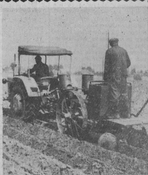
Mechaniczne sadzenie ziemniaków w PGR Owińska (woj. poznańskie)

Najwięcej uwagi projektanci i wykonawcy poświęcą w najbliższym czasie budowie tzw. dróg szybkich, które umożliwią pojazdom mechanicznym rozwijanie znacznych szybkości.