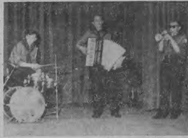
Gdy na scenie wystąpiła sekcja rytmiczna drużyny harcerskiej przy Technikum Mechanicznym — oklaskom i okrzykom „bis” — nie było końca. NA ZDJĘCIU: występ sekcji rytmicznej białostockiej „siódemki”.