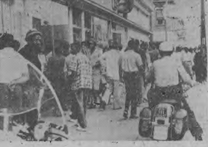
NA ZDJĘCIU: na ulicach Birmingham zmotoryzowani policjanci kraja po chodnikach nie dopuszczając w ten sposób do uformowania się pochodu demonstrantów.

Na posiedzeniu Komitetu Wykonawczego omówiono również inne zagadnienia.