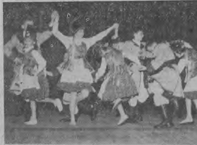
Balet drużyny harcerskiej przy szkole nr 23 podobał się widzom.

Publiczność, która w niedzielę wypełniła salę Kino-Teatru Związków Zawodowych, serdecznie oklaskiwała występy harcerskich zespołów artystycznych, biorących udział w dorocznych eliminacjach.