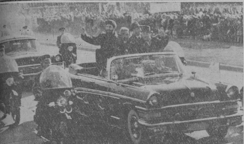
NA ZDJĘCIU: w samochodzie N. S. Chruszczow i Fidel Castro przejeżdżają ulicami Moskwy.

Proletariusze wszystkich krajów, łączcie się!