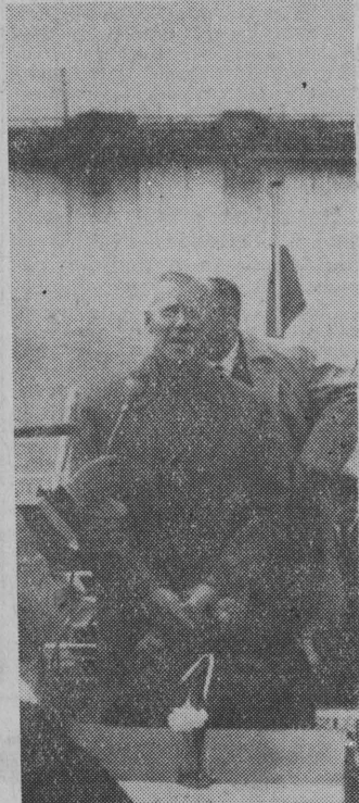
NA ZDJĘCIU: przemawia wicepremier Zenon Nowak.

Uroczystego otwarcia kanału dokonał wicepremier Zenon Nowak.