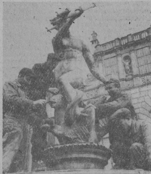
W związku ze zbliżającym się świętem klasy robotniczej stocznioy gdańskiej podjęły zobowiązanie przeprowadzenia kapitalnego remontu urządzeń wodociagowych i oświetlenia elektrycznego Studni Neptuna na Długim Targu w Gdańsku.