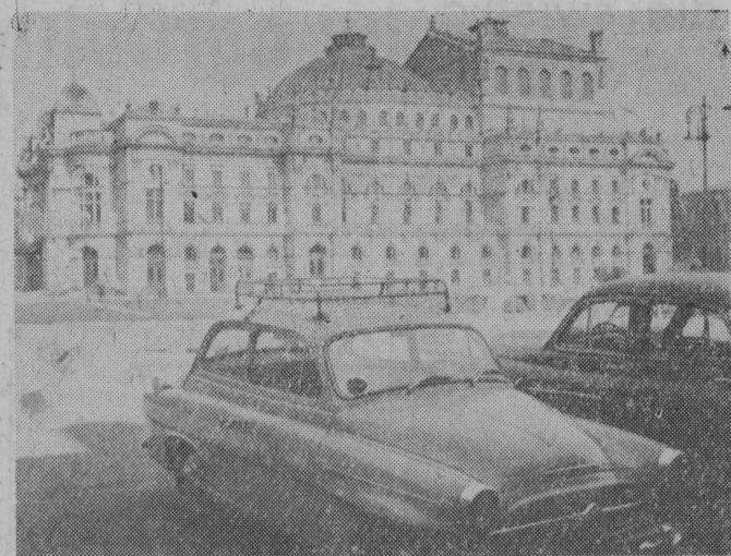
NA ZDJĘCIU: KRAKÓW — gmach teatru im. Stowackiego.