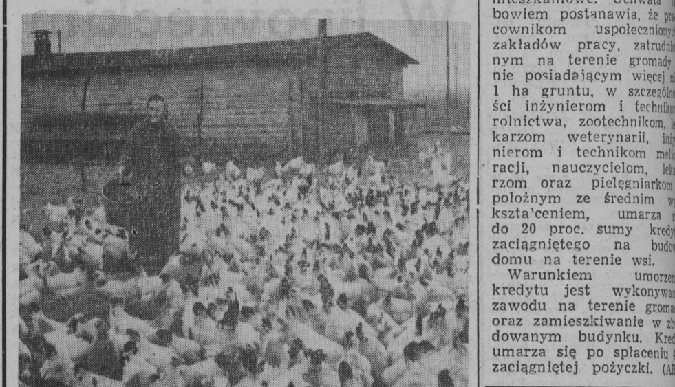
Na fermie drobiu.

16 MLN ZŁ KREDYTÓW POD RĘKĘ UMORZENIU 20 PROC. KREDYTU W DOLGIE UMORZENIU