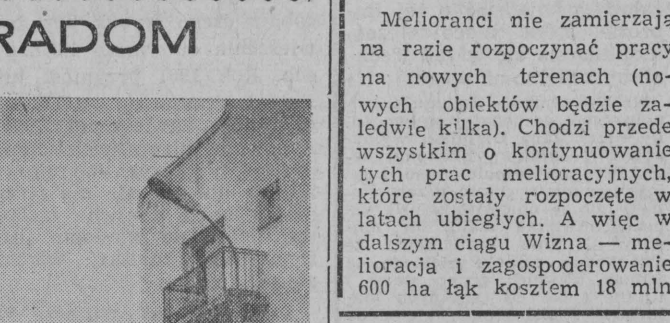
Spółdzielcze bloki mieszkalne przy ulicy Sportowej.

W zjeździe weźmie udział 189 delegatów z całego województwa. Obrady toczyć się będą w gmachu Zarządu Wojewódzkiego TPP-R przy ul. Sienkiewicza 1. Początek o godz. 10. (k)