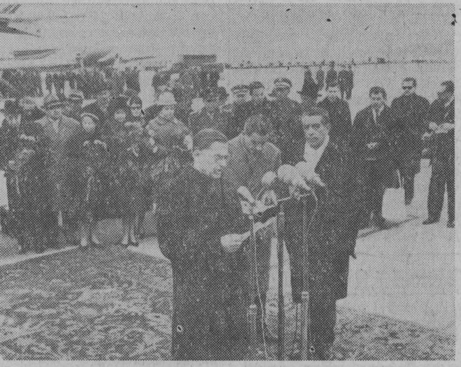
NA ZDJĘCIU: uroczystość powitania prezydenta Meksyku na lotnisku Okęcie w Warszawie — przemówienie powitalne wygłasza Aleksander Zawadzki — obok prezydent Lopez Mateos.

WARSZAWA (PAP) — We wtorek rozpoczęły się obrady plenarnego posiedzenia KC ZMS. Tematem obrad są aktualne zadania w dziedzinie umocnienia organizacji i pogłębienia jej społecznego charakteru.