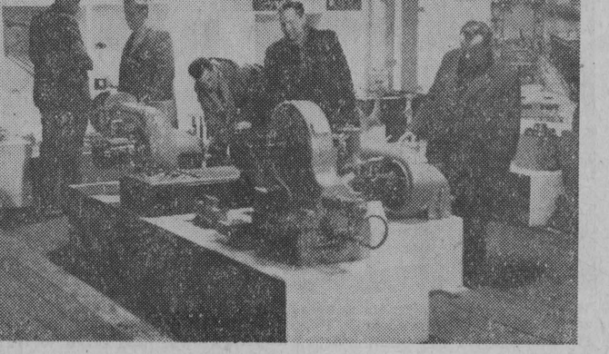
W Katowicach otwarto ogólnokrajową wystawę „Eksport - import” zorganizowaną staraniem Wojewódzkiego Komitetu PZPR w Katowicach.

Na pewno niejednym inżynier i technik nie będzie mógł w właściwym czasie wykonać sprzętu melioracyjnego. Niejedna maszyna pomaga jeszcze „zeby” na białostockich bagnach. Najważniejsze jednak jest, iż że łąki są coraz bardziej zielone, rzeczki czystsze, ziele, pola — urodzajniejsze. I. Z.