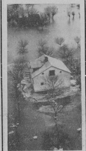
Na Wiśle nie ma już niebezpieczeństwa, sytuacja przestała być groźna. Choć w dalszym ciągu trzeba jeszcze likwidować zator lodowy pod Maciejowicami, nie należy już przewidywać niebezpieczeństwa. NA ZDJĘCIU: tak wyglądał przed paru dniami Dolina Maciejowska.

Poważnie wzrośnie produkcja, a jednocześnie jakość kopacek ziemniaczanych z fabryki sprzętu rolniczego „Pionier” w Strzelcach Opolskich.