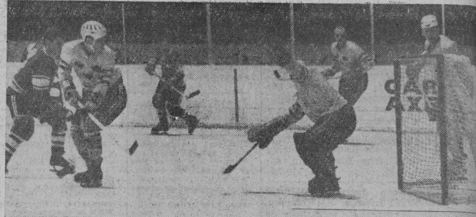
NA ZDJĘCIU: fragment meczu Szwecja — ZSRR

— Treningi rozpoczęliśmy już w początkach grudnia ubiegłego roku zająciami dwa razy tygodniowo w sali gimnastycznej. W pierwszej fazie poświęciliśmy uwagę ćwiczeniom siłowym i sprawnościowym. W okresie