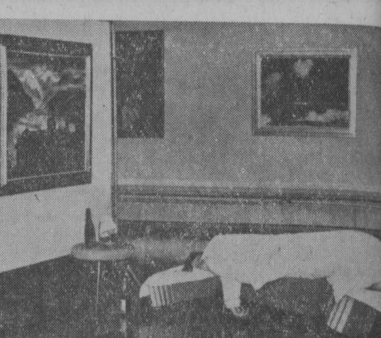
Dyrektor wystawy malarstwa w Tuebingen (NR) angażowała studenta, który ustawił sobie na nocoko cennych obrazów.

Najdokładniejszym zegarem świata jest tzw. zegar atomowy. Wskazuje on czas z dokładnością 1 sekundy na 300 lat.