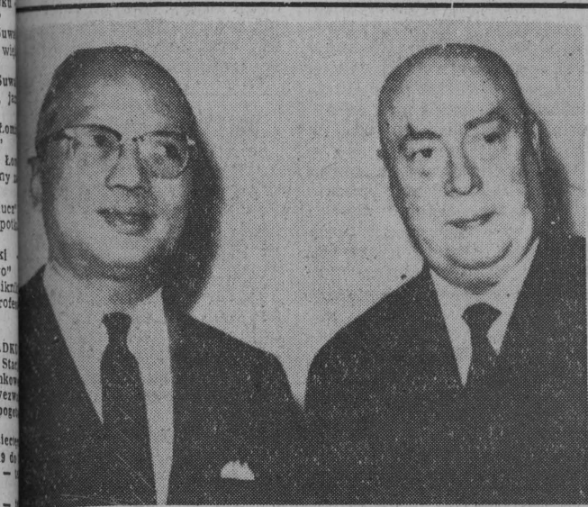
Podczas pobytu w Nowym Jorku premier Józef Cyrankiewicz spotkał się z sekretarzem ONZ U. Thantem.