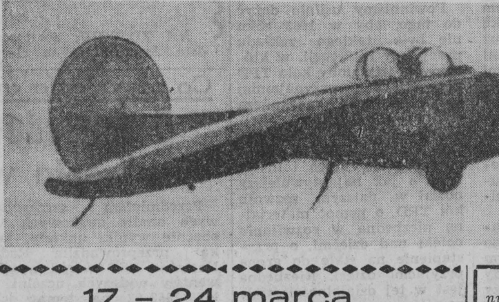
17 - 24 marca XI Targi Krajowe - „Wiosna-63”

W tym kontekście należy pamiętać, że w Niemczech trwa proces przemian. Władze państwa starają się znaleźć drogę do porozumienia i współpracy. W tym celu konieczne jest wypracowanie wspólnych zasad i celów.