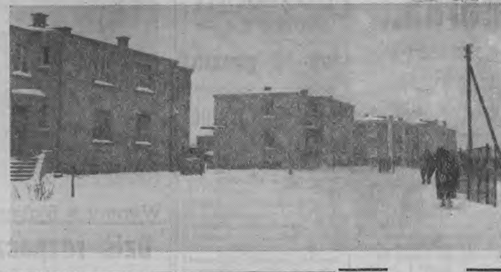
Fragment nowego osiedla mieszkaniowego.

Powierzchnia powiatu wysokomazowieckiego wynosi 945,8 km kw. W powiecie znajduje się 18 jednostek administracyjnych, w tym jedno miasto — Wysokie Mazowieckie i 17 gromad.