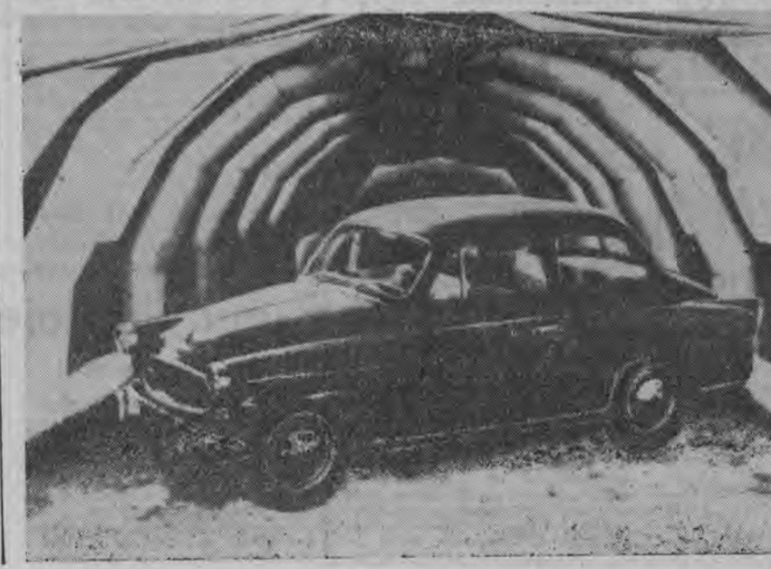
Specjaliści czeskosłowaccy opracowali model plastikowego, nadmuchiwane go garażu. Wewnętrzne jego wymiary: długość 9 m, szerokość 6 m i wysokość 3 m. Przenośny i łatwo montowany w dowolnym miejscu, garaż taki może stanowić schron dla kilku samochodów osobowych, doskonale izolując je od wpływu atmosferycznych. (WIT-AR)

WROCŁAW — słabsze wiatry. Temperatura bez zmian.