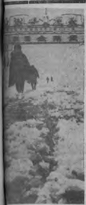
Instalowane pośrodku jezdni w ulicy miasta Nagaoka urządzenie do skrapiania nawierzchni, obecnie zastosowane z pozytywnym skutkiem do topienia zwałowisk.

LONDYN (PAP) — Dwudziestu jeden górników poniosło śmierć w poniedziałek w południowoafrykańskiej kopalni złota. Górnicy zjeżdżali piętrową windą do jednego z najgłębszych chodników kopalni. Na głębokości 21 metrów winda stanęła wskutek samoczynnego uwolnienia się hamulców. Gdy ją ponownie uruchomiono — po trzech godzinach — 21 górników już nie żyło, a 48 leżało bez przytomności.