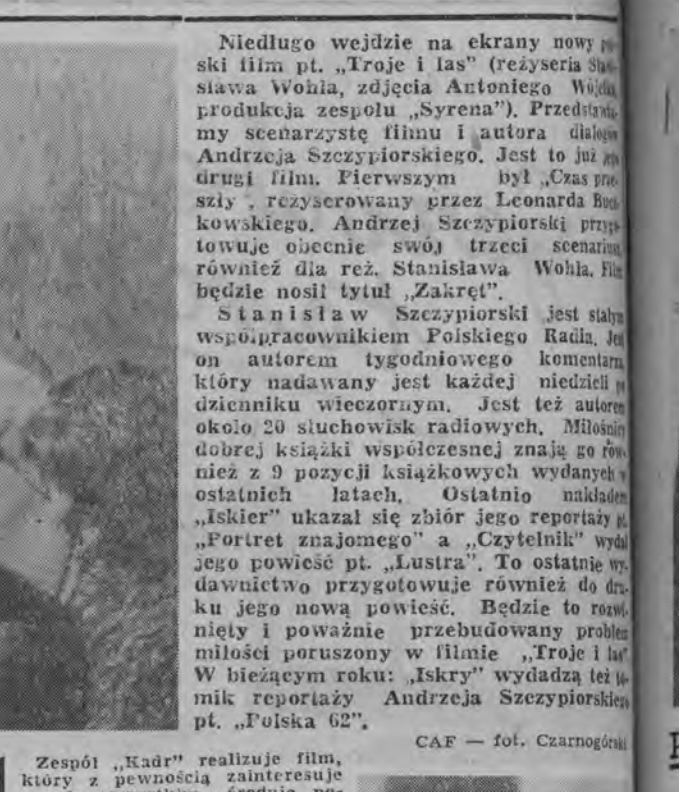
Zespół „Kadr” realizuje film, który z pewnością zainteresuje przede wszystkim „średnie pokolenie”. Będzie to filmowa wersja popularnej powieści T. Dołęgi - Mostowicza „Pamiętnik pani Hanki”. Reżyseruje S. Lenartowicz. Na pierwszym planie — filmowa wersja powieści T. Dołęgi - Mostowicza „Pamiętnik pani Hanki”. Reżyseruje S. Lenartowicz. Na pierwszym planie — filmowa wersja powieści T. Dołęgi - Mostowicza „Pamiętnik pani Hanki”. Reżyseruje S. Lenartowicz.