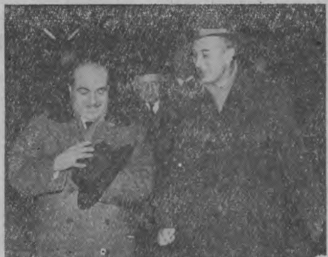
NA ZDJĘCIU: minister Luigi Preti w towarzystwie ministra Handlu Zagranicznego W. Trąpczyńskiego na Dworcu Głównym w Warszawie.

W związku z rokowaniami handlowymi polsko-włoskimi w dniu 5. II. 1963 r. przybył do Warszawy minister Handlu Zagranicznego Włoch, Luigi Preti.