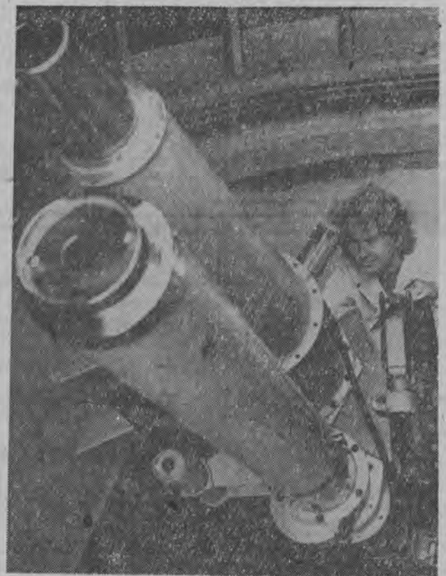
Astronomowie dawno już stwierdzili, że słońce wysyła energię bardzo nierównomiernie. Obecnie na przykład, aktywność słoneczna spada i w latach 1964 — 65 będzie minimalna...