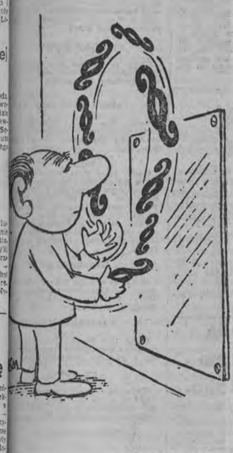
Rys. K. Mozolewski