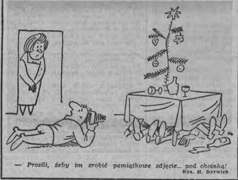
— Proszili, żeby im zrobić pamiątkowe zdjęcie... pod choinką! Rys. H. Derwich

zerył, z obawy przed odpowiedzialnością, nie powiadomił władz o ucieczce krokodyla”. Teraz już wszystko jest jasne. Prawdopodobnie gdyby podobny wypadek zdarzył się dziś u nas w Białymstoku — do krokodyla nie potrzeba byłoby strzelać. Po prostu w czarnej Białej ten egzotyczny zwierzę po kilku minutach by zdechł.