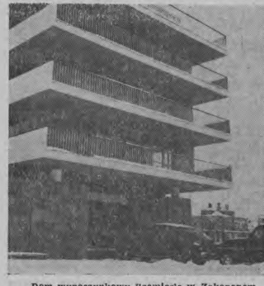
Dom wypoczynkowy Rzemiosła w Zakopanem