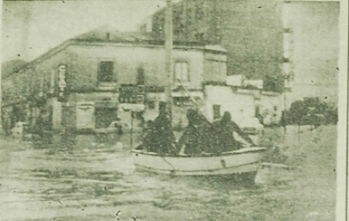
Podajęce od kilku dni ulewnie deszcze stały się przyczyną katastrofalnej powodzi we Włoszech. Wiele rzek wysiępiło z brzojeu, zalewując miasta i wioski. Straty materialne są znaczne. NA ZDJĘCIU: komunikacja do zalatnym miście Capua LABANIM na czele stanął na stanowisku współdziałania z rządem hasadistycznym.

Współną cechą wszystkich tych przedsięwzięcia jest atakowanie polskiej i ludowej orki — w kierunku i narodu polskiego. Nie wiele dziwnego, że tego rodzaju kampania antypolska coraz wyświeca w niej oszczerstwa i insynuacje wywołują obrzębia i FARBOWY polskiego pochodzenia i Polaków zamieszkałych od dawna we Francji.