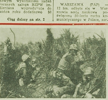
Żołnierze amerykańscy kryją się w wysokiej trawie podczas walk w pobliżu Da Nang. Jak donosi tygodnik, w DRW dziennik „Quan Doi Nam Dan” w okresie od 20 listopada do 9 grudnia żołnierze poludniowowietnamscy ucywilizowali z 7000 ludzi ponad tysiąc żołnierzy i ocalałych nieprzyjaciół.

Strajk, jak i poprzednie tego rodzaju akcje, jest wyrazem niezadowolonych pracowników z wyjątkiem strajku w przemyśle włókienniczym, który jest bezrobociu i pogarszającym się warunkom pracy i życia.